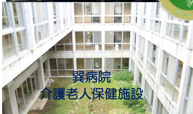
巽病院 介護老人保健施設