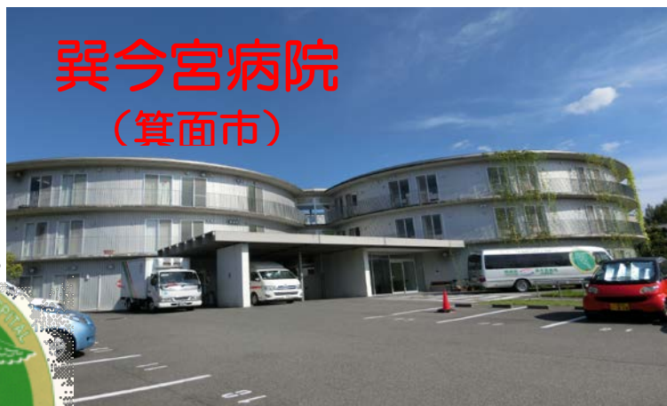
巽今宮病院 (箕面市)