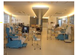
【改装が終了したD棟3階】