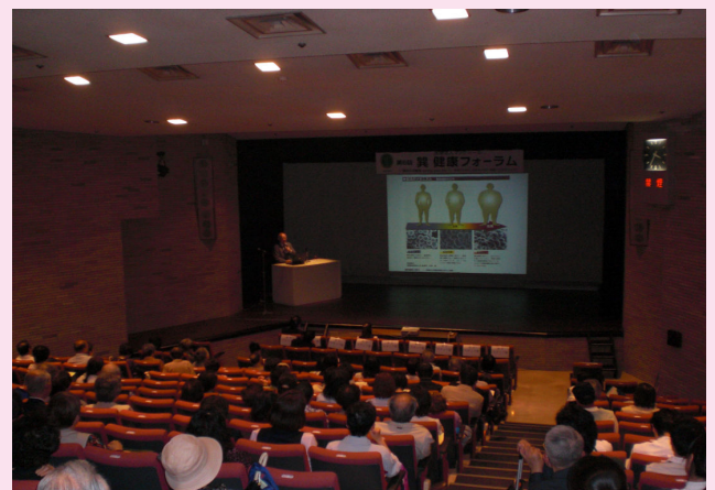
<高山医師による講演「メタボ健診」>