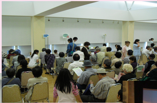
<北豊島中学校吹奏楽部による演奏>