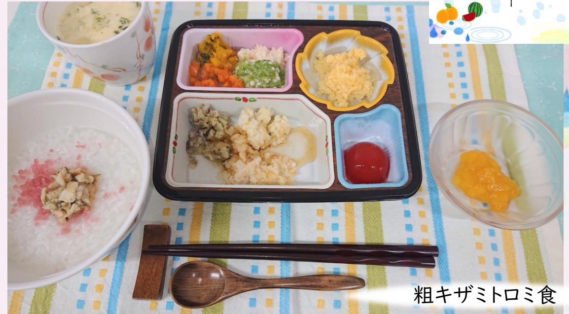
粗キザミトロミ食

今年度は、老健スタッフ手作りの各利用者さまに向けた夏らしい色味のお品書きカードが用意され、昨年、好評だった散らし寿司やトマトの酢の物の入ったお食事でも楽しいランチタイムをお過ごしいただきました。